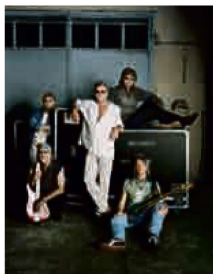
40 ans de légende pour le mythique groupe Deep Purple.

Deep Purple In Rock, sorti en juin 1970, peut être considéré comme le premier album de hard rock pur. Puis Machine Head, comportant leur chanson la plus connue: Smoke on the Water, ainsi que l'album en public Made in Japan sont incontournables dans leur discographie. Mais les tensions au sein du groupe sur la direction musicale à prendre ont vite fait exploser le groupe pour le reformer ensuite en 1984 sans toutefois que les tensions ne disparaissent. John Lord quittera définitivement le groupe en 2002. Désormais composé de Ian Gillan (chant), Steve Morse (guitare), Roger Glover (basse), Ian Paice (batterie), et Don Airey (orgue et claviers), Deep Purple a sorti en 2003 puis 2005 deux albums rappelant ses grandes années: Bananas et Rapture of the deep. Une expérience scénique et musicale aux sonorités violacées.