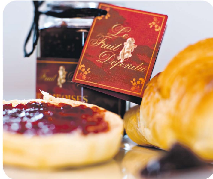
Des confitures haut de gamme en séries limitées.

Comme pour une bonne bouteille de vin, chaque pot produit fait